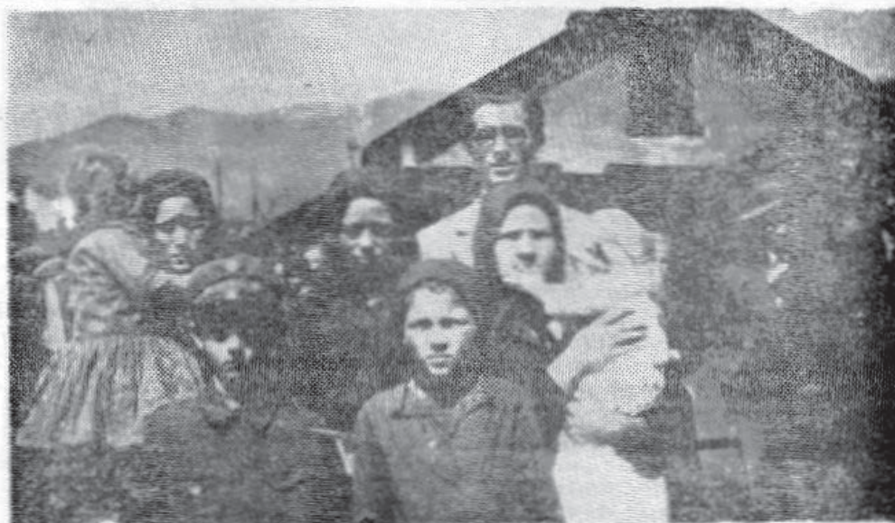
Panait Istrati alături de văduvele și copiii minerilor din Valea Jiului, victime ale masacrului de la Lupeni, în 1929

jin. El a înțeles cel mai bine, colindând lumea, că ceea ce numim noi internaționalism nu este un cuvânt oarecare. A luptat, a fost dezamăgit de multe ori, a încercat să-și ia viața, nu din lașitate, ci pentru că mizeria era prea apăsătoare și nu mai găsea nici o ieșire. A fost salvat de un binefăcător care atunci când Panait Istrati a înțeles o ciltă față a lucrurilor, a spus adevărul. Romain Rolland nu l-a iertat, ca și alții, foști amici, decizându-se de adevărul lui. Rareori se întâmplă ca marii orgolioși, care sînt scriitorii, să recunoască, mai devreme sau mai târziu că s-au înșciat. El a făcut-o. Și acest act de libertate interioară i-a apărut nu numai posteritatea literară, ci și conștiința.