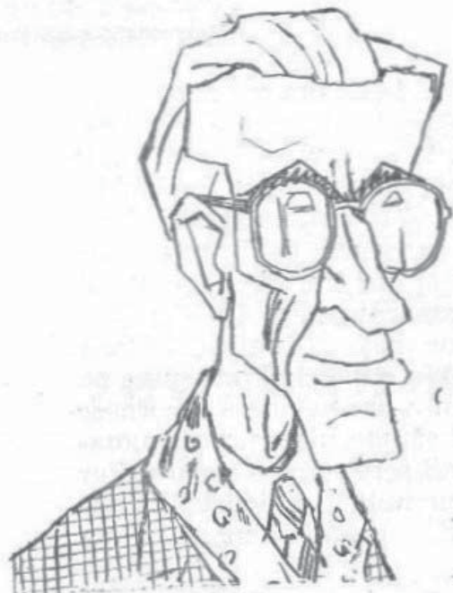
Desen de Silvan Ionescu