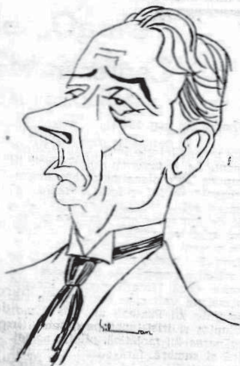
Desen de Silvan Ionescu

Carte densă, în primul rînc de atmosferă, procedeele stilistice la modă