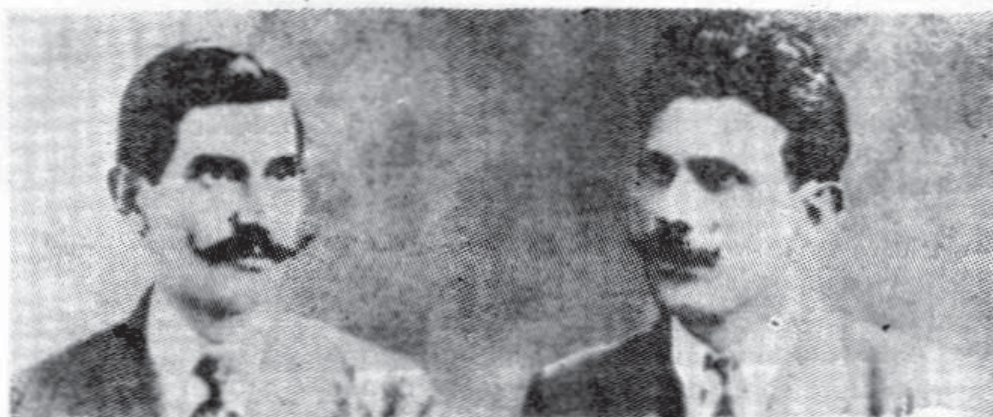
Panait Istrati și Ștefan Gheorghiu, conducătorii marii greve a hamalilor din Brăila (1910)

du-mă de la preocupările mele științifice (studiam fizico-chimicele). El mi-a deschis fereastra spre marea literatură universală. Îl iubea pe Eminescu, din adolescență, opera lui ținându-i tovărășie, reconfortându-l în anii de vagabondaj peste mări și țări. Într-o zi, mi-a spus : „Am auzit că ai citit Chira mea, în traducerea de la „Adevărul”. Ți-ai dat seama cu câtă neghiobie a fost tradusă ?” Pe vremea aceea nu știam ce este o traducere bună. M-a învățat, mai apoi, cum să citesc o carte : „În un creion în mână, cum vezi că fac și eu. Și dacă îți place ceva — o expresie, o idee sau te amuză cumva, — subliniază-le”. Înainte, fie că-mi plăcea sau nu o carte, o citeam dintr-o răsufelare, ca mai toată lumea, de altfel, fără să rețin nimic.