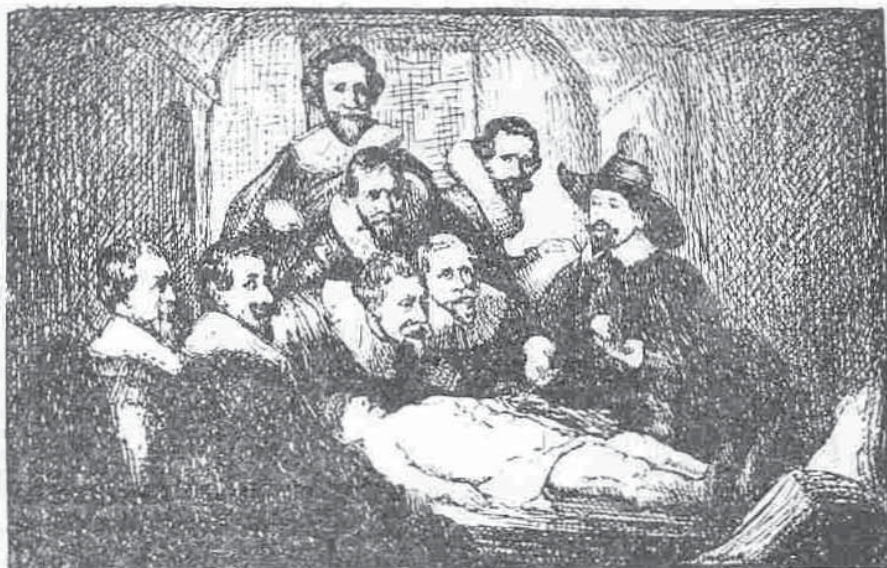
„Lecția de anatomie“

despre «anatomia mâinii». Priviții cât de naturali sunt, cât de bine este redată expresia figurilor lor. Rembrandt a fost și psiholog și în acest tablou el a înscris o pagină de psihologie profundă; fie-care figură este ast-fel alcătuită, încât îți trădează și firea și starea sufletească a fiecărui personaj. Unde mai pui culoritul și aranjarea ansamblului făcute cu