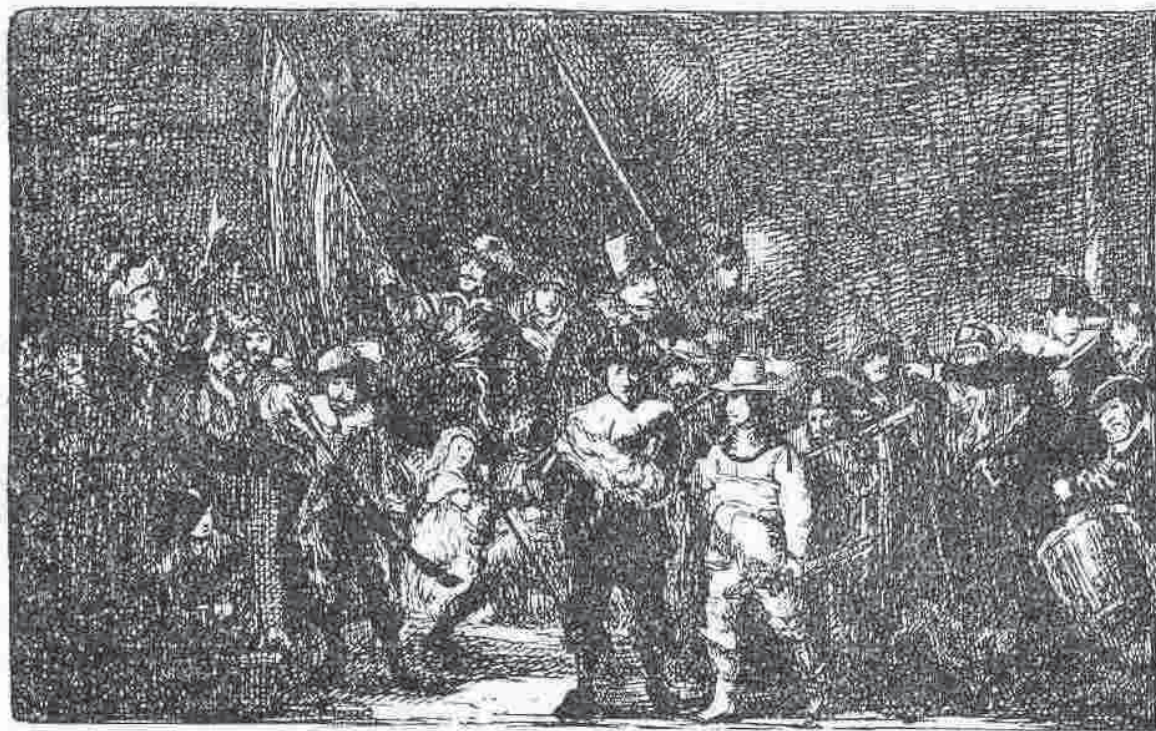
„Rondul de noapte”

Fie care ființă, fiecare trăsătură, până și câinele care speriat de zgomotul tobei o ia la goană lătrând, toate în acest admirabil tablou