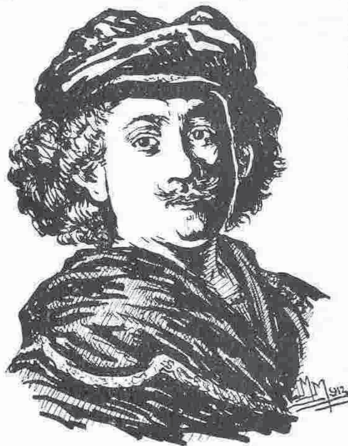
Rembrandt după un auto-portret

Născut la Leyda [Olanda] în 1606, el urmă acolo la școală, unde ca elev nu prea lăsa să se întrezărească talentul său; eră printre elevii mediocrii. La 16 ani avu ca profesor de pictură pe van Swanenburch,